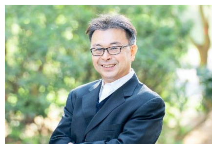
<専門分野> 指数理論 / 応用計量経済学 / 多変量解析

2022年1月より、当社グループ参画。社外取締役を経て、2024年7月より、当社研究・開発組織『PropTech-Lab』所長に就任。