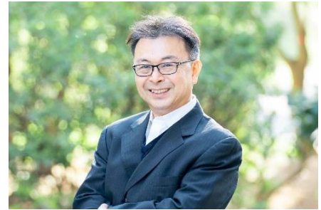
<専門分野> 指数理論 / 応用計量経済学 / 多変量解析

2022年1月より、当社グループ参画。2024年7月より、当社研究・開発組織『PropTech-Lab』所長に就任。